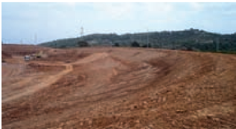
Obras de regulación para recarga de los excedentes invernales del río Belcaire (Vall de Uixó, Castellón). Vista aérea general de la Balsa nº4.

Vamos a licitar en los próximos meses algunas de estas actuaciones muy rápidamente, dentro de Murcia la Acequia Mayor de Molina y los regadíos de Librilla, y luego, en la Comunidad Valenciana, en Valencia en particular, otra serie de proyectos del Campo del Turia que tenemos ya muy avanzados, y en Castellón la modernización de algunos regadíos del Mijares. Finalmente, la rehabilitación del embalse de Arenós, para los mismos regadíos, un proyecto técnicamente bastante complejo.