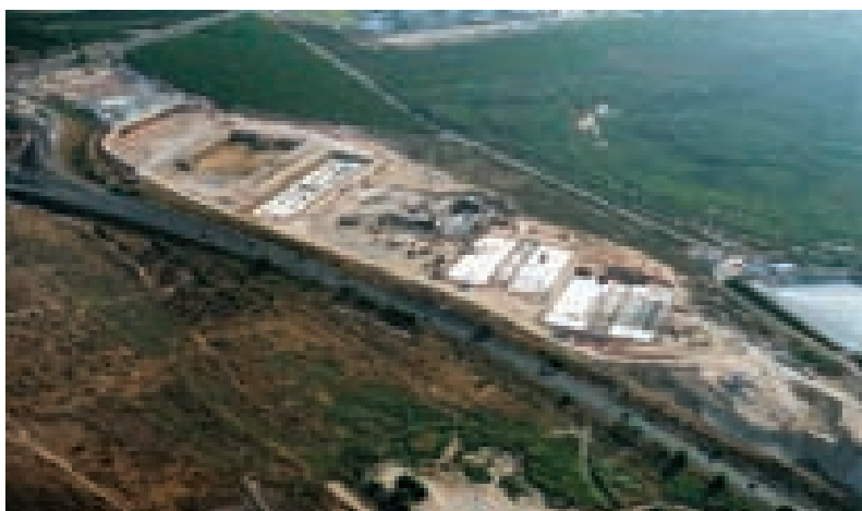
Vista aérea general de las obras de la Planta Desaladora de Torre Vieja.

licitar, sin duda de aquí a final de año, una de forma inmediata que es la de Oropesa, porque se acaba de emitir la declaración de impacto ambiental y por consiguiente la vamos a licitar enseguida, y posteriormente, de aquí a final de año desde luego, licitaremos también la de Moncófar y la de Fuengirola, la segunda desaladora de la Costa del Sol.